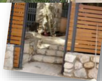
גדר דמוי עץ אלומיניום שלבים צרים